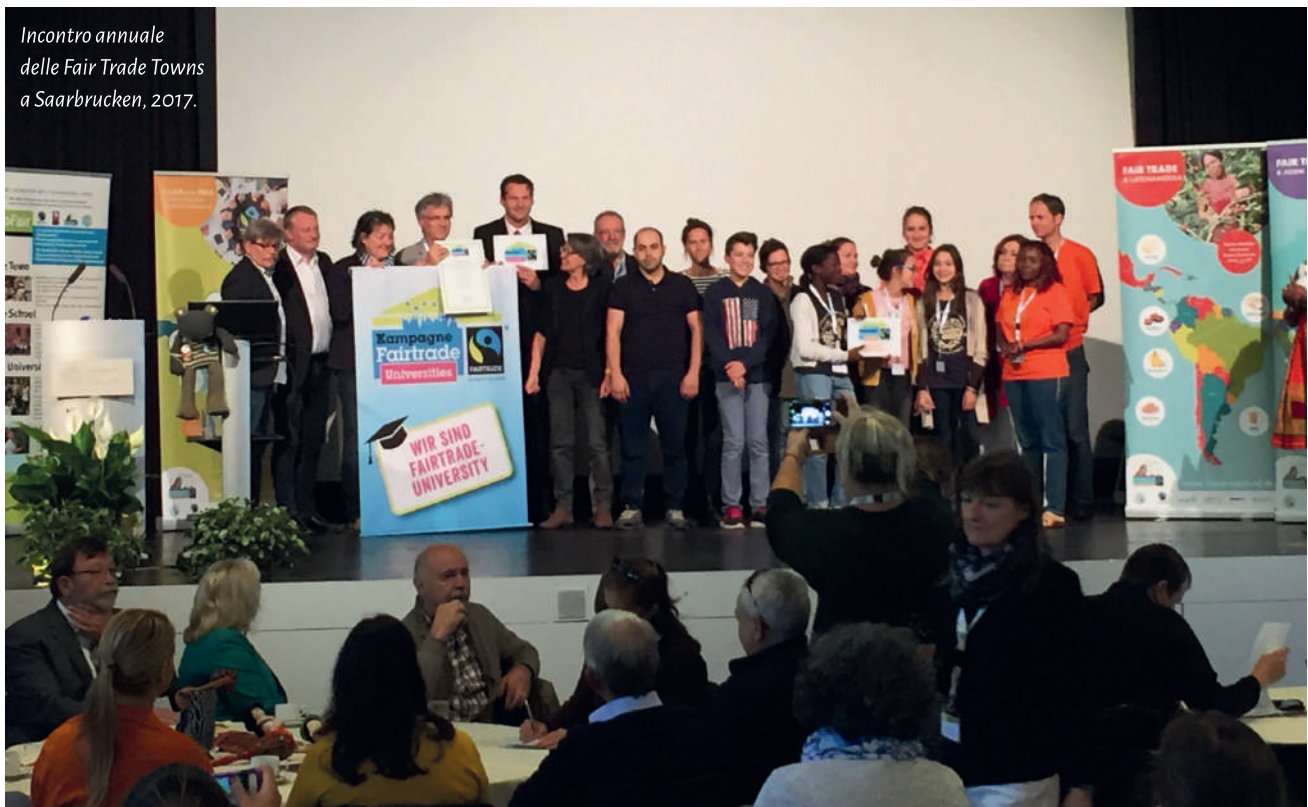
Incontro annuale delle Fair Trade Towns a Saarbrücken, 2017.

È composto da un numero variabile definito dall'ente aderente e sufficientemente rappresentativo delle organizzazioni di Commercio Equo e Solidale sul territorio; aziende che producono e/o distribuiscono i prodotti Commercio Equo e Solidale; associazioni, gruppi religiosi, scout che promuovono il Commercio Equo e Solidale, la Finanza Etica, il Turismo Responsabile nei cosiddetti Paesi in Via di Sviluppo; studenti e genitori delle scuole del Territorio; università e istituti di ricerca; istituti scolastici; settore HoReCa (negozi, bar ristoranti, esercizi pubblici). Il Gruppo Territoriale di Sostegno ha come obiettivo quello di mettere in pratica le azioni a supporto del Commercio Equo e Solidale.